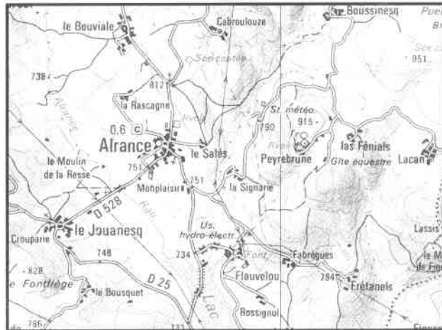
Carte IGN 2440 / 1:50 000